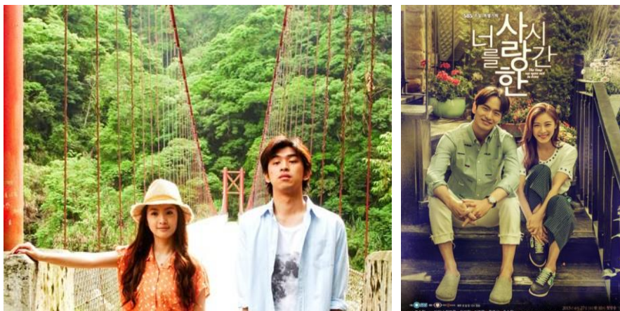
图3 《我可能不会爱你》演绎了一段30岁的百货公司鞋区区长程又青和航空公司的地勤督导李大仁之间“一个关于‘特别的朋友’的故事”。

2014年由李东允执导，张赫、张娜拉主演的《命运一样爱着你》改编自《命中注定我爱你》在韩国同样获得了超高的好评，张赫和张娜拉也因此剧被韩国观众评为最佳情侣。