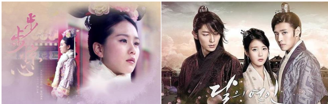
图 4 《步步惊心》讲述了现代白领张晓因车祸穿越到清朝康熙年间，成为满族少女马尔泰·若曦，她看透所有人的命运，却无法掌握自己的结局，身不由己地卷入“九子夺嫡”的纷争的故事。

《爱你的时间》是韩国 SBS 于 2015 年 6 月 27 日起播出的周末特别企划剧，改编自《我可能不会爱你》。由赵秀沅、高在贤执导，河智苑、李阵郁等主演。讲述了一对有着 17 年友情的朋友在年过而立之际的感情变化，并最终浪漫结合的故事。