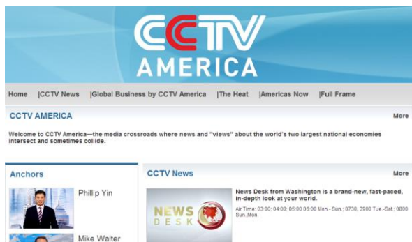
图 1 CCTV America 官网页面