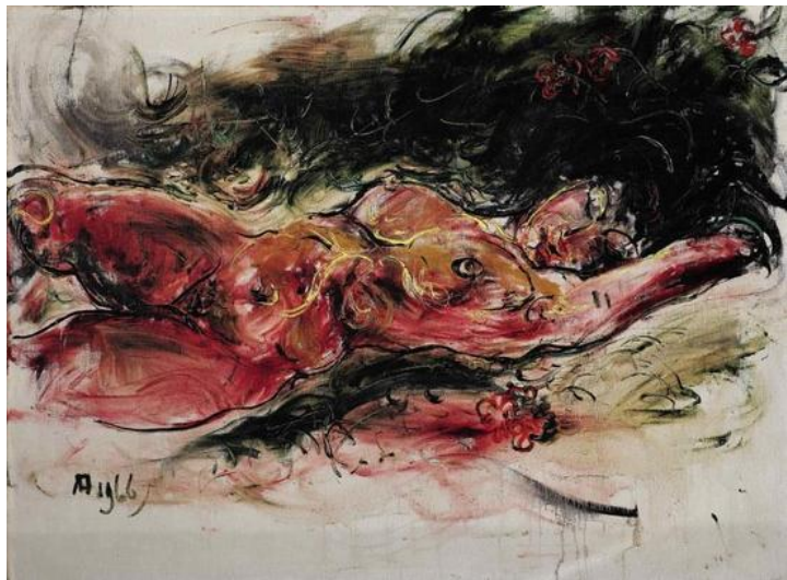
图 7 《裸女卧像》-1966