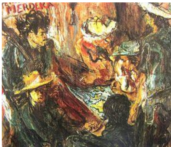
图 4 《Laskar rakyat mengatur siasat》-1946