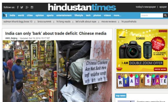
图 2 印度斯坦报官网页面

第七，指出华为对印度的肯定态度。“我们相信，印度的增长潜力和未来，我们将继续寻找机会，以增加我们的在这里的存在感。”华为印度 CEO Jay Chen 在一份声明中说道。第八，指明华为的后续作为和中国其他相关行动。“华为还将扩大其印度零售网络，与它的合作伙伴在今年年底将增加到超过 50000 个销售点。中国其他制造商也有在印度设立的。2015 年，中国的小米公司联手与台湾的电子产品合同制造商富士康在印度组装手机。”