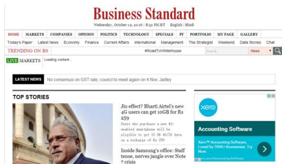
图 3 印度商业标准报官网页面

华为将会提供 4G 技术。 华为表示，它准备为推出网络印度移动运营商提供先进的 4G 解决方案。“我们将为印度电信运营商介绍我们的最新技术和解决方案。我们将以最好的技术 4G，4.5G 甚至 5G，印度华为首席执行官 Jay Chen 说。政府将从 10 月 1 日开始频谱拍卖，如果空气波在他们的基地的价格出售，预计将获得 5.66 万亿卢比。