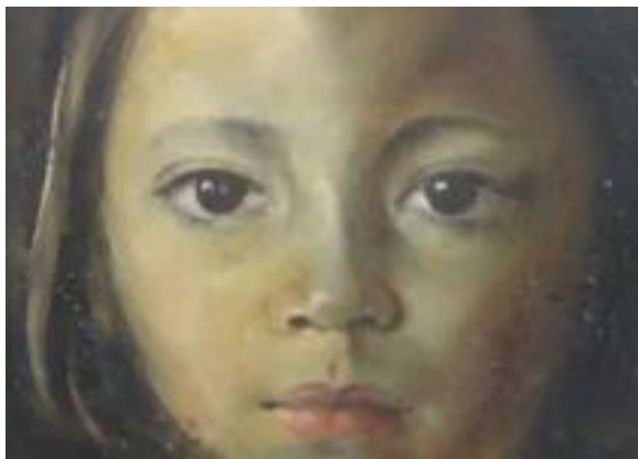
图 3 《Kartika》-1941

印度尼西亚这一时期的绘画艺术家普遍受到阿凡迪的影响，风格开始变化，都开始表达自己的个人观点和民族思想。