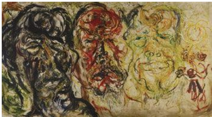
图 6 《叁味人生》-1966

《叁味人生》这幅作品主要体现了作者对人类大众情感三个层面的探讨,仔细品味这幅画,我们很容易从中感受到一个从对现实的恐惧到对和平的希望与渴望的过程。首先,我们看到画面中的第一个形象,阿凡迪运用了代表黑暗的黑紫色、代表惶恐与焦虑的黄色,再加上由于害怕而呈现的表情,不用过多的修饰,就让我们深刻感受到了画家所要表达的对于当时社会状态的恐惧和彷徨,也令人联想起他对艺术以及人生,皆同样有的一份热切与渴望。