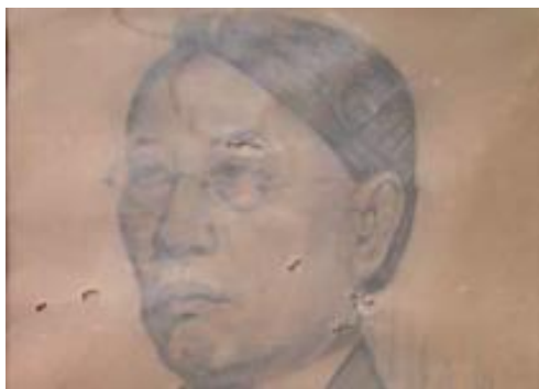
图1 《Ki Gemblo》-1936

“Ki Gemblo”是阿凡迪的叔叔，同样来自西爪哇省井里汶市。这幅画是阿凡迪自己学习如何通过有形的形式才能到自然的开始。